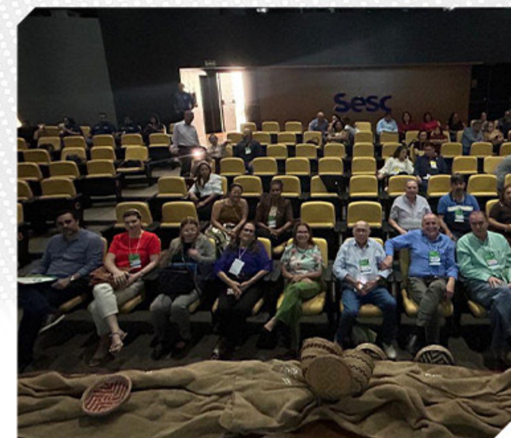
II CONFERÊNCIA NACIONAL DO TRABALHO