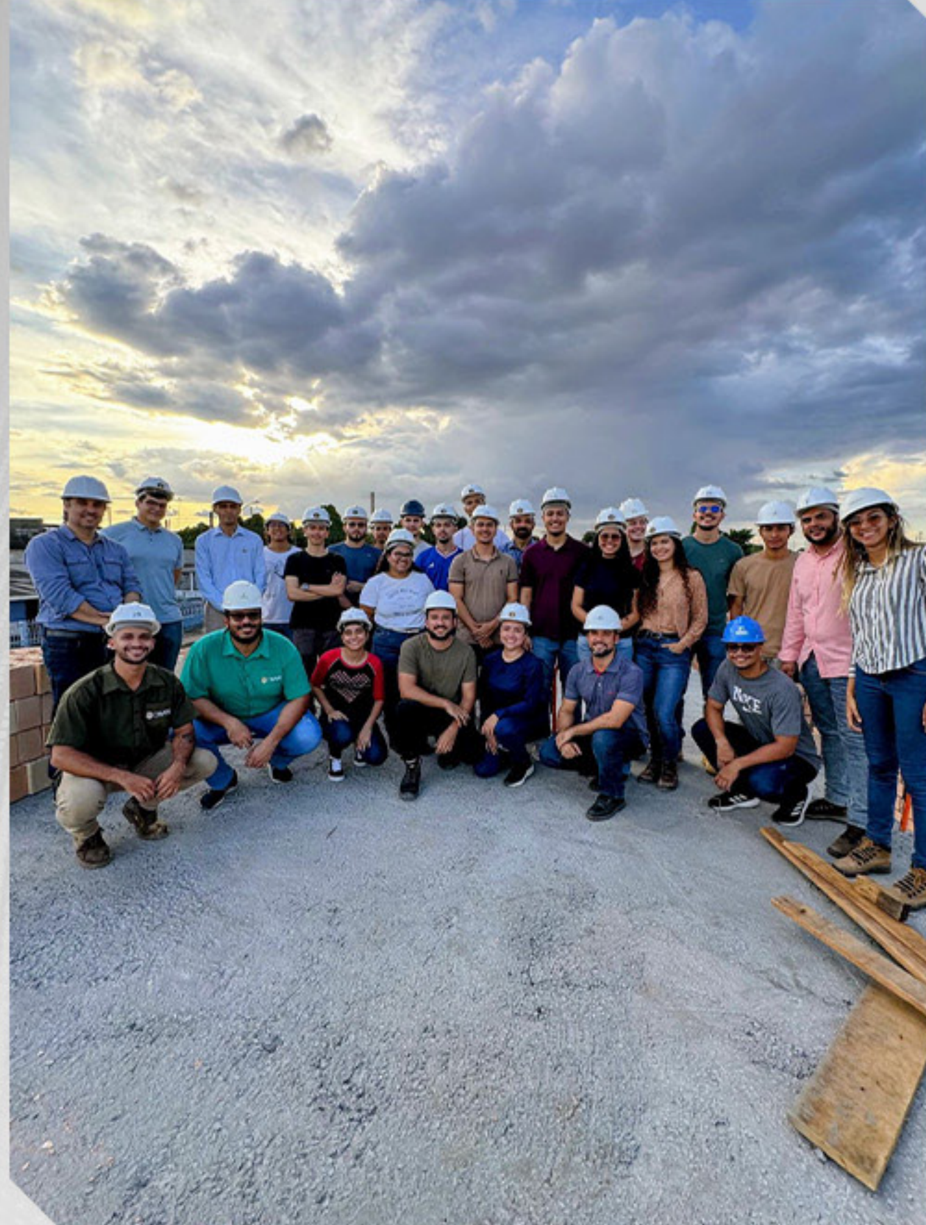
VISITA TÉCNICA A EMPRESA COEMA