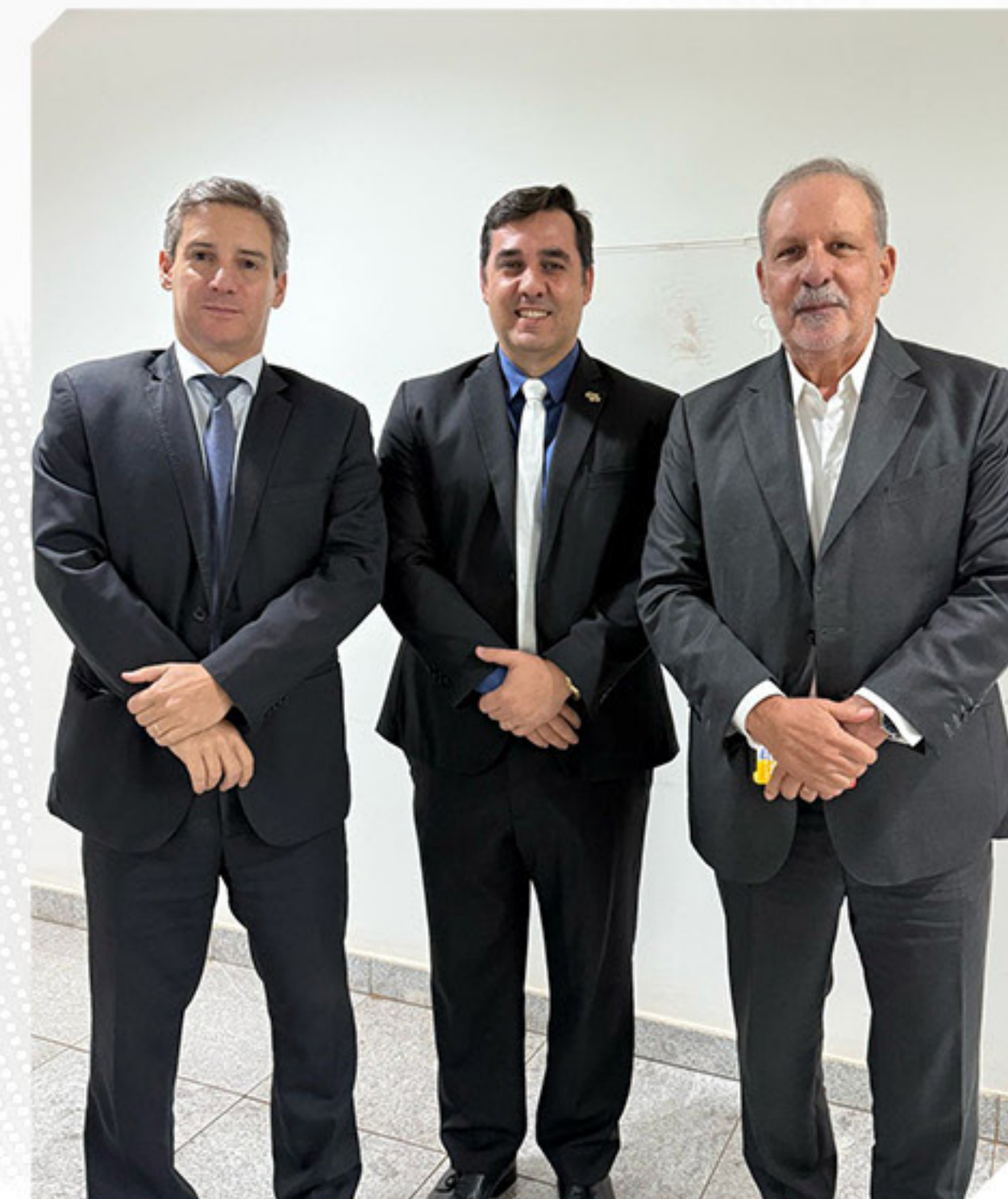
CONSELHO TEMÁTICO DE ASSUNTOS TRIBUTÁRIOS E FISCAIS (CONTRIF)