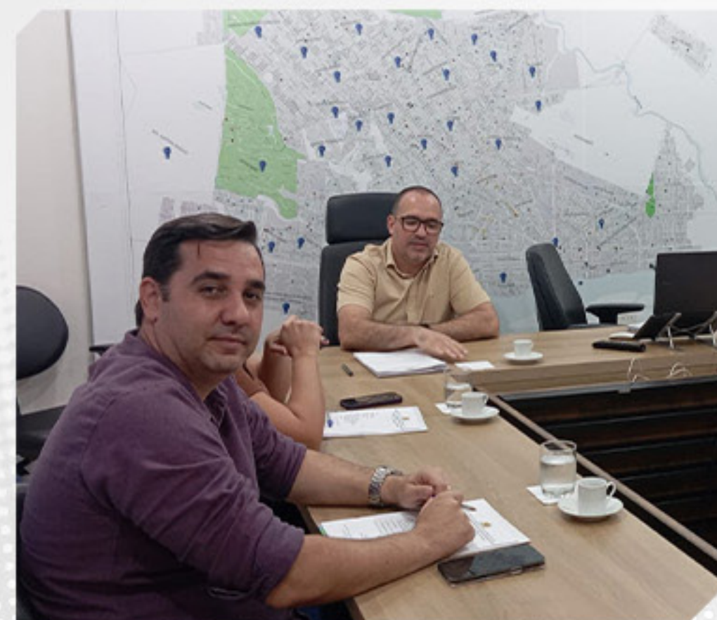
REUNIÃO CONSELHO MUNICIPAL DE MEIO AMBIENTE