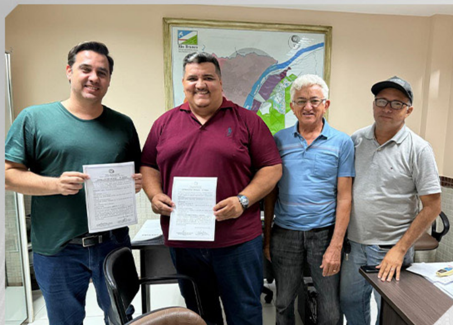
REUNIÃO COM A EMPRESA TRIUNVIRATO