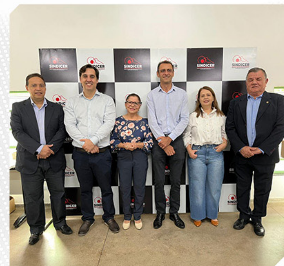
MINITREINAMENTO "EXECUÇÃO DE ALVENARIA ESTRUTURAL COM BLOCOS CERÂMICOS"