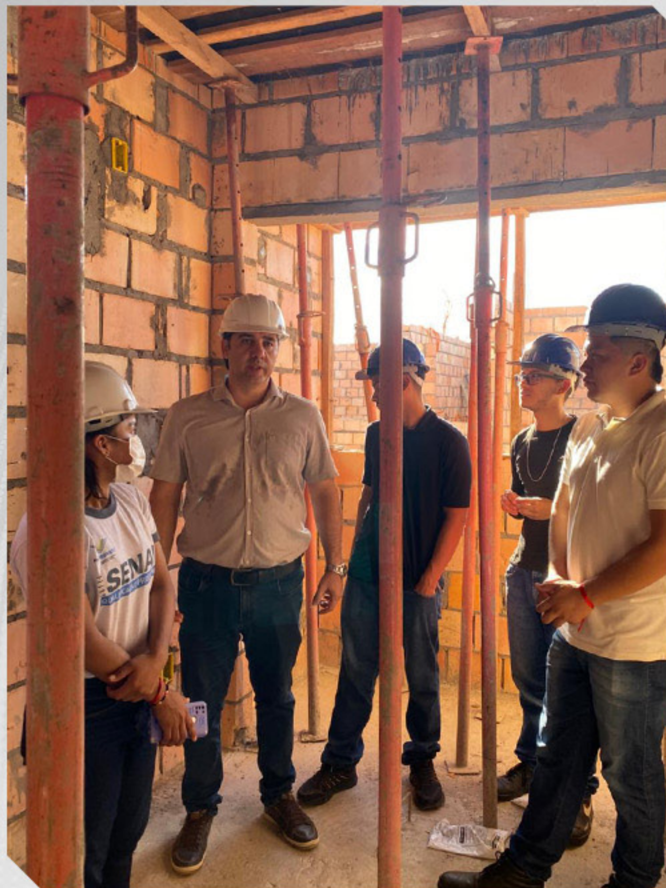
VISITA TÉCNICA A EMPRESA COEMA