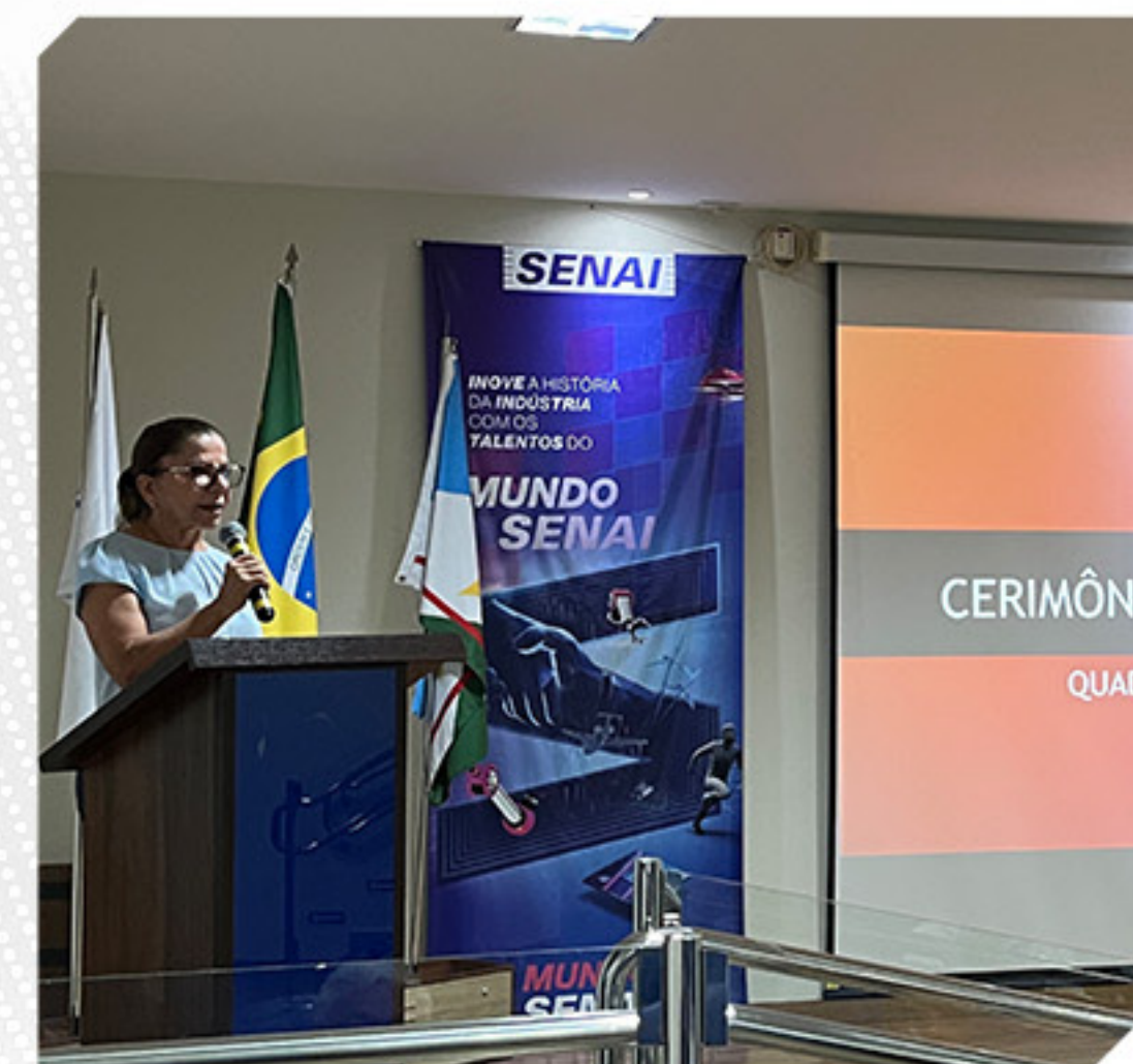
POSSE DA NOVA DIRETORIA