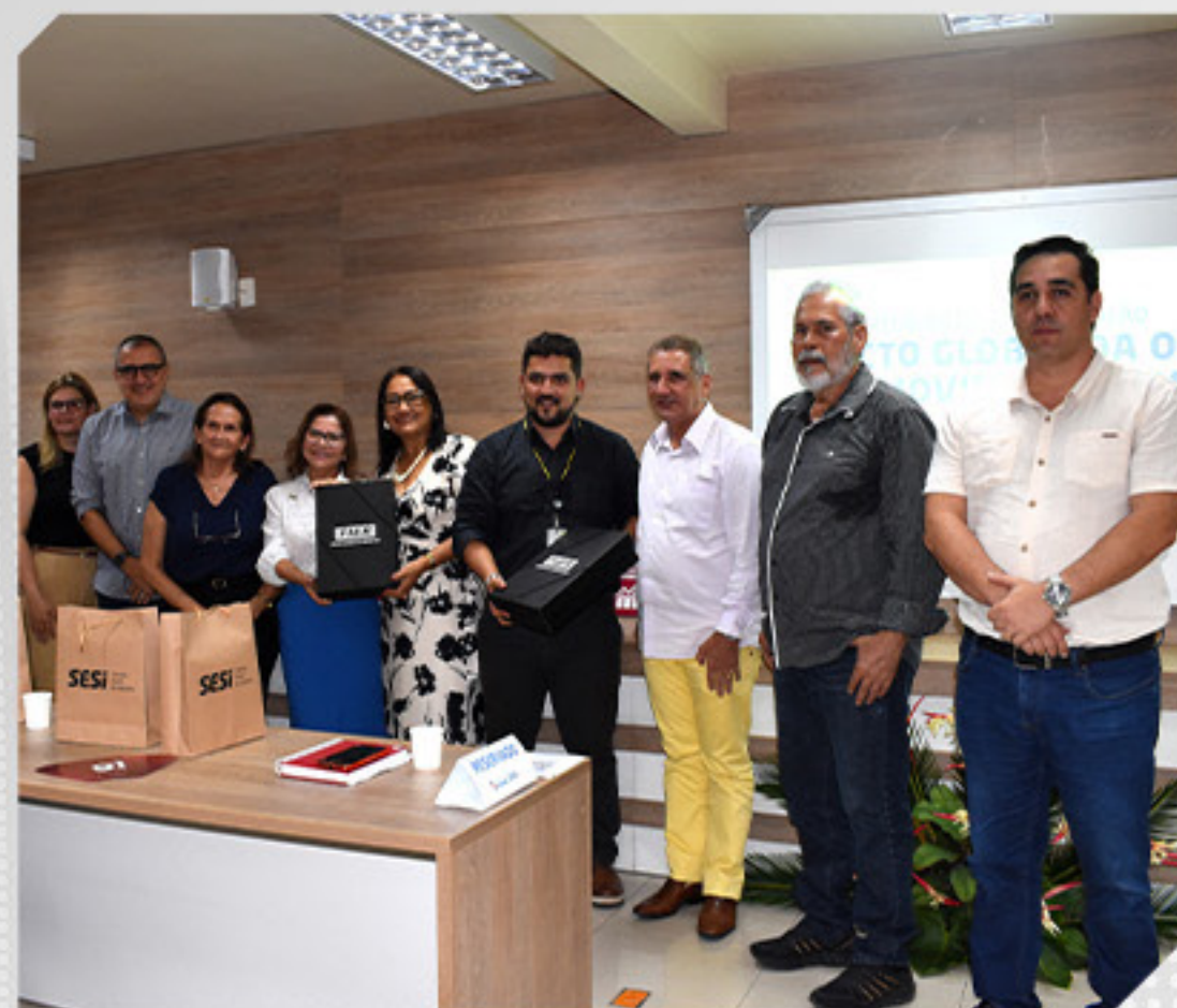
ASSINAMOS O DOCUMENTO PACTO GLOBAL DA ODS

Marcamos presença no evento promovido pela Confederação Nacional da Indústria (CNI) e a Federação das Indústrias do Estado de Roraima (FIER com o objetivo de discutir os desafios do setor produtivo e propor soluções para impulsionar o desenvolvimento industrial). O evento "Diálogos sobre a Competitividade – Combate ao Custo Brasil".