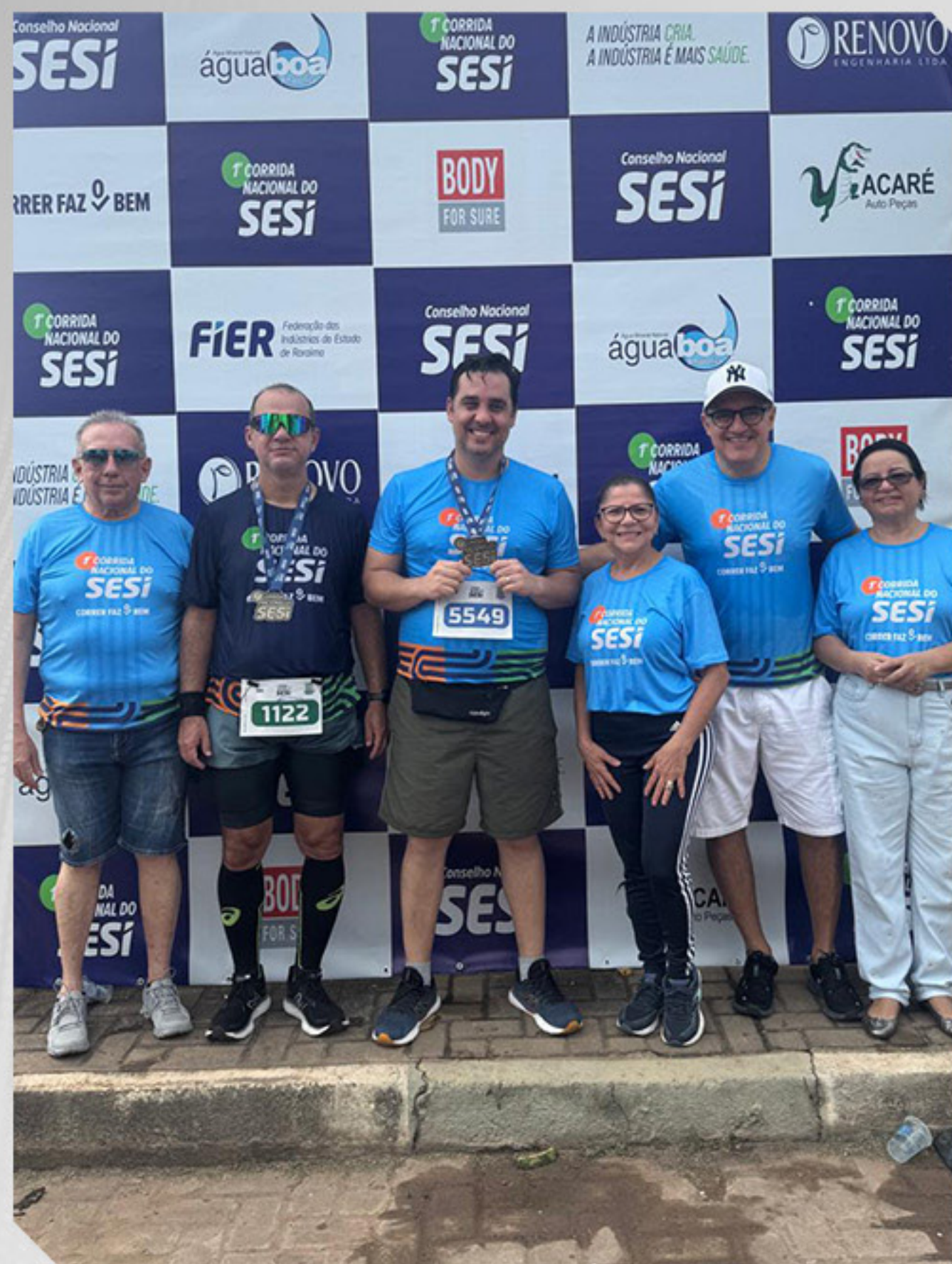
1ª CORRIDA NACIONAL DO SESI