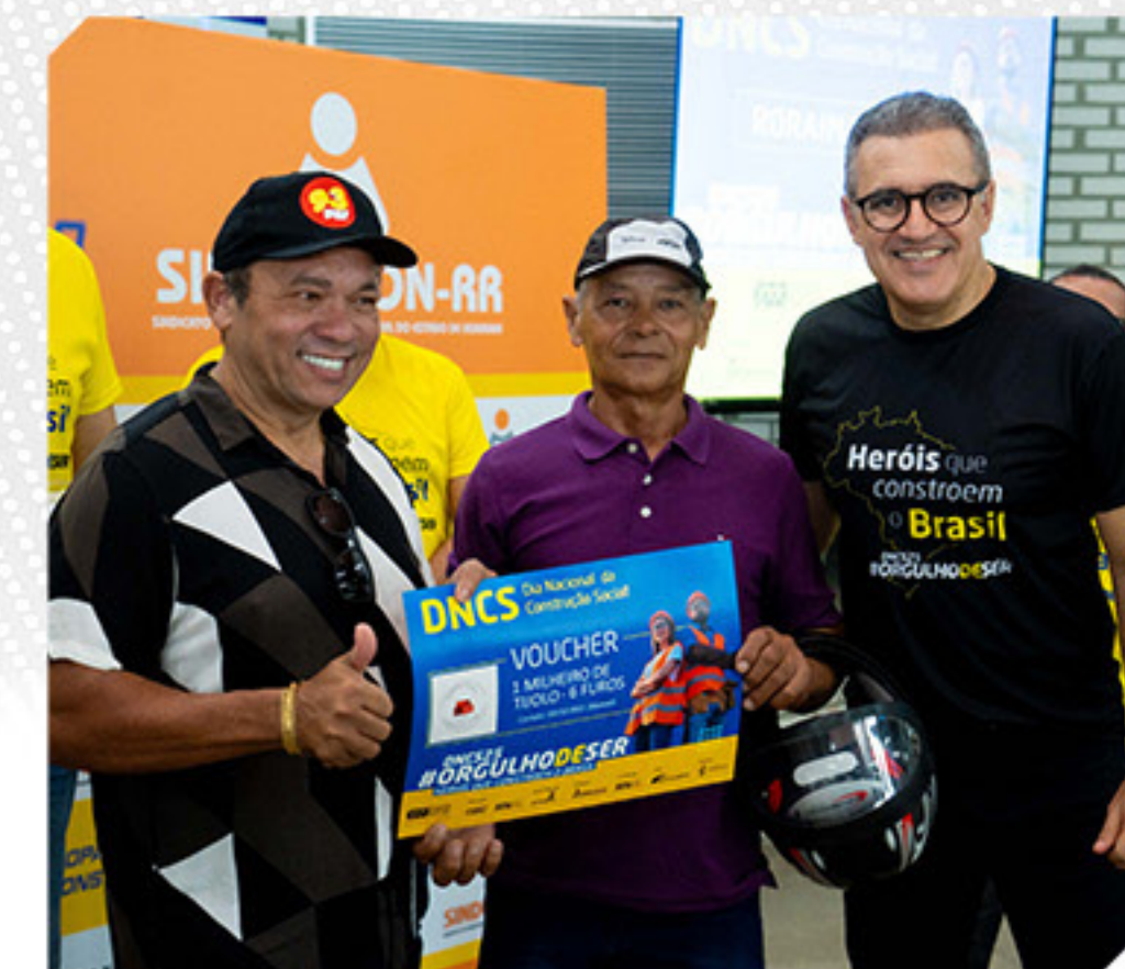
DOAÇÃO DE BRINDES PARA O SORTEIO DO DIA NACIONAL DA CONSTRUÇÃO SOCIAL