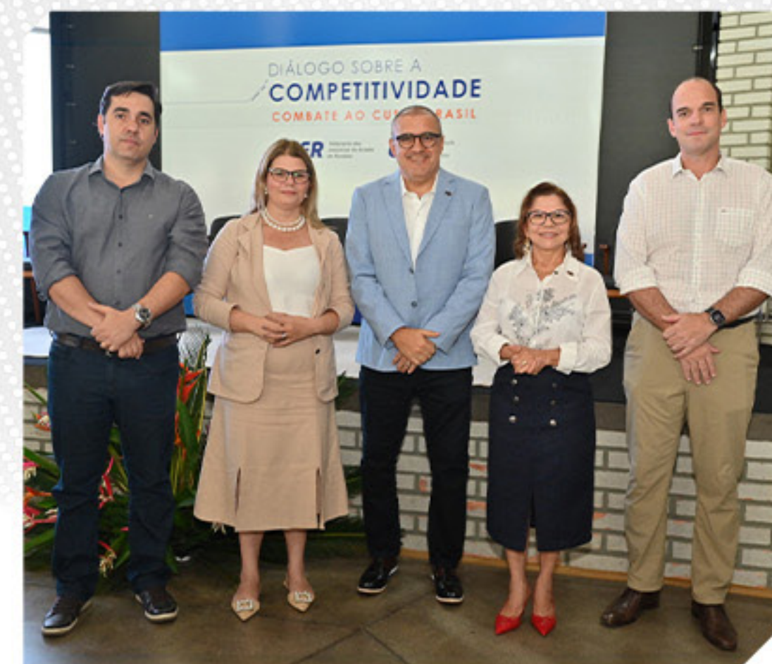
EVENTO "DIÁLOGOS SOBRE A COMPETITIVIDADE – COMBATE AO CUSTO BRASIL"