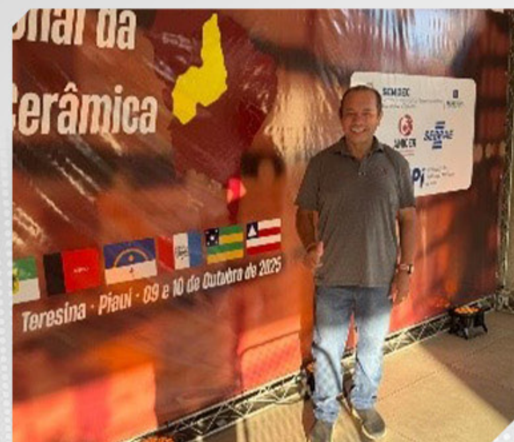
ENCONTRO DA CERÂMICA VERMELHA

Participamos por meio do membro da diretoria em evento nacional Encontro da Cerâmica Vermelha, promovido pelo sindicato do Piauí, em Teresina.