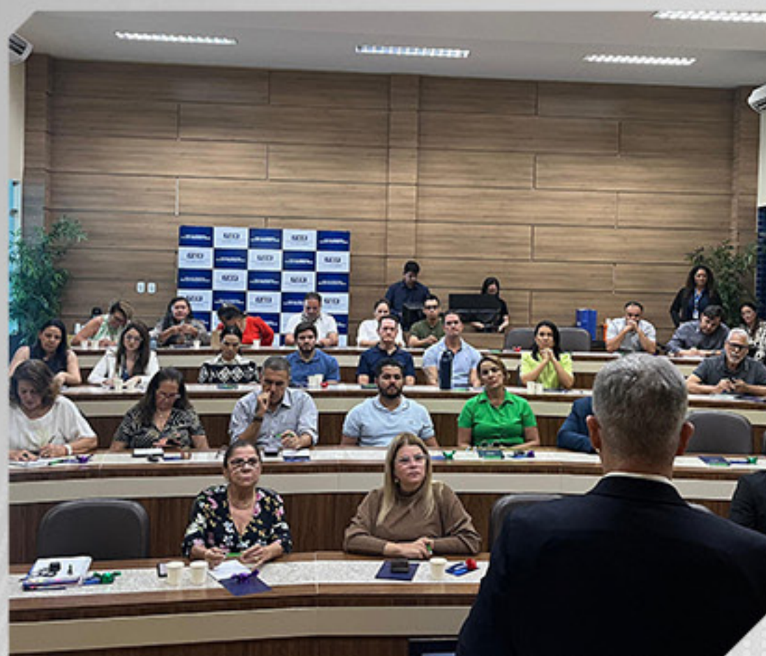
PARTICIPAÇÃO NA PALESTRA FUTURO DOS NEGÓCIOS PROMOVIDO PELA FIER.