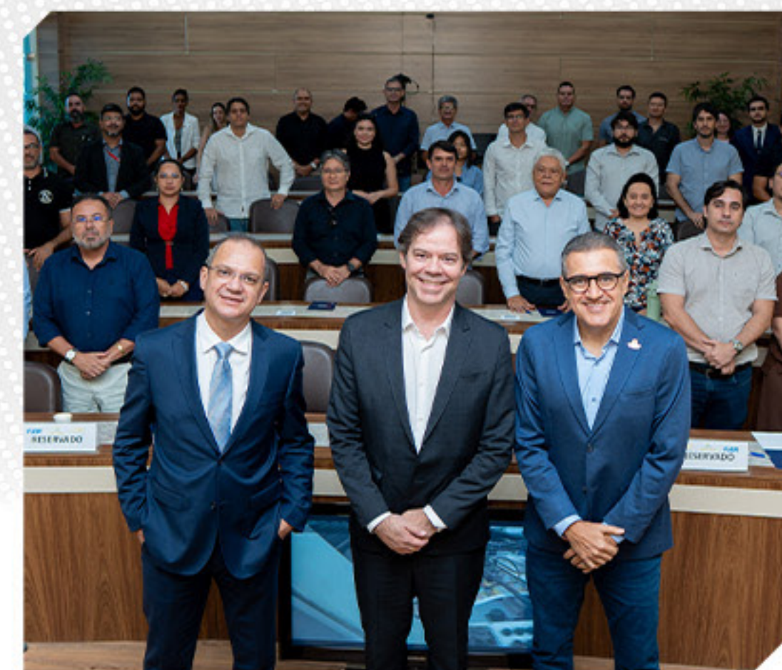
SEMINÁRIO JURÍDICO PROMOVIDO PELO SINDUSCON-RR