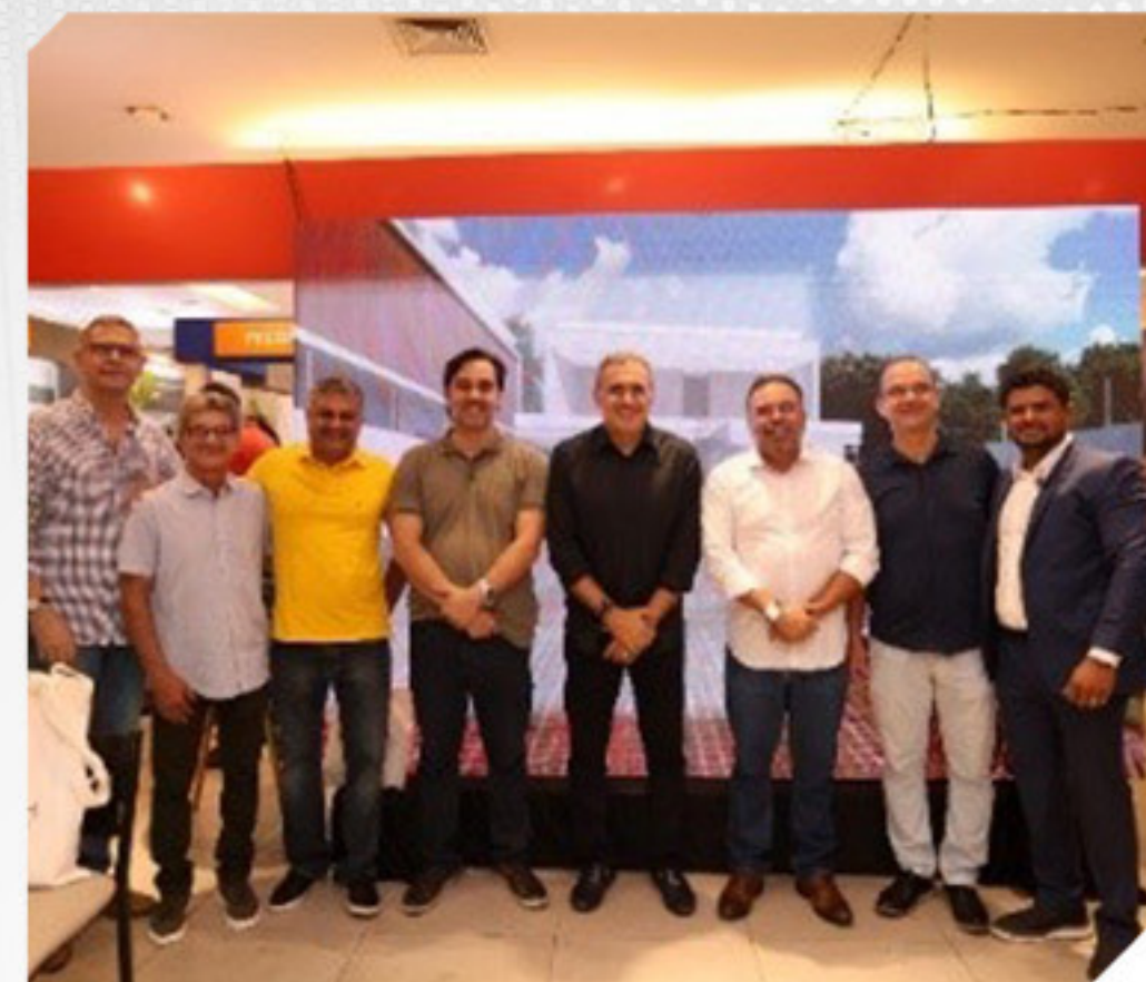
2ª EDIÇÃO FEIRA CONSTRUA MAIS RORAIMA

Participamos da 2ª Edição Feira Construa Mais Roraima que se consolidou como um dos principais eventos do estado para networking, negócios e inovação na construção civil, tendo a participação de uma empresa associada, a cerâmica Orinoco.