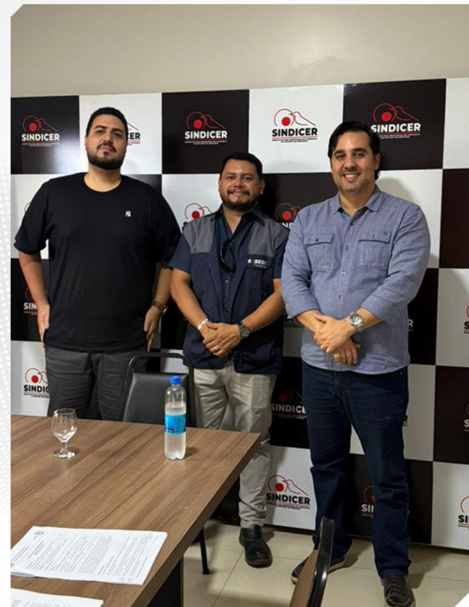
REUNIÃO COM O SESI/RR E O NACIONAL