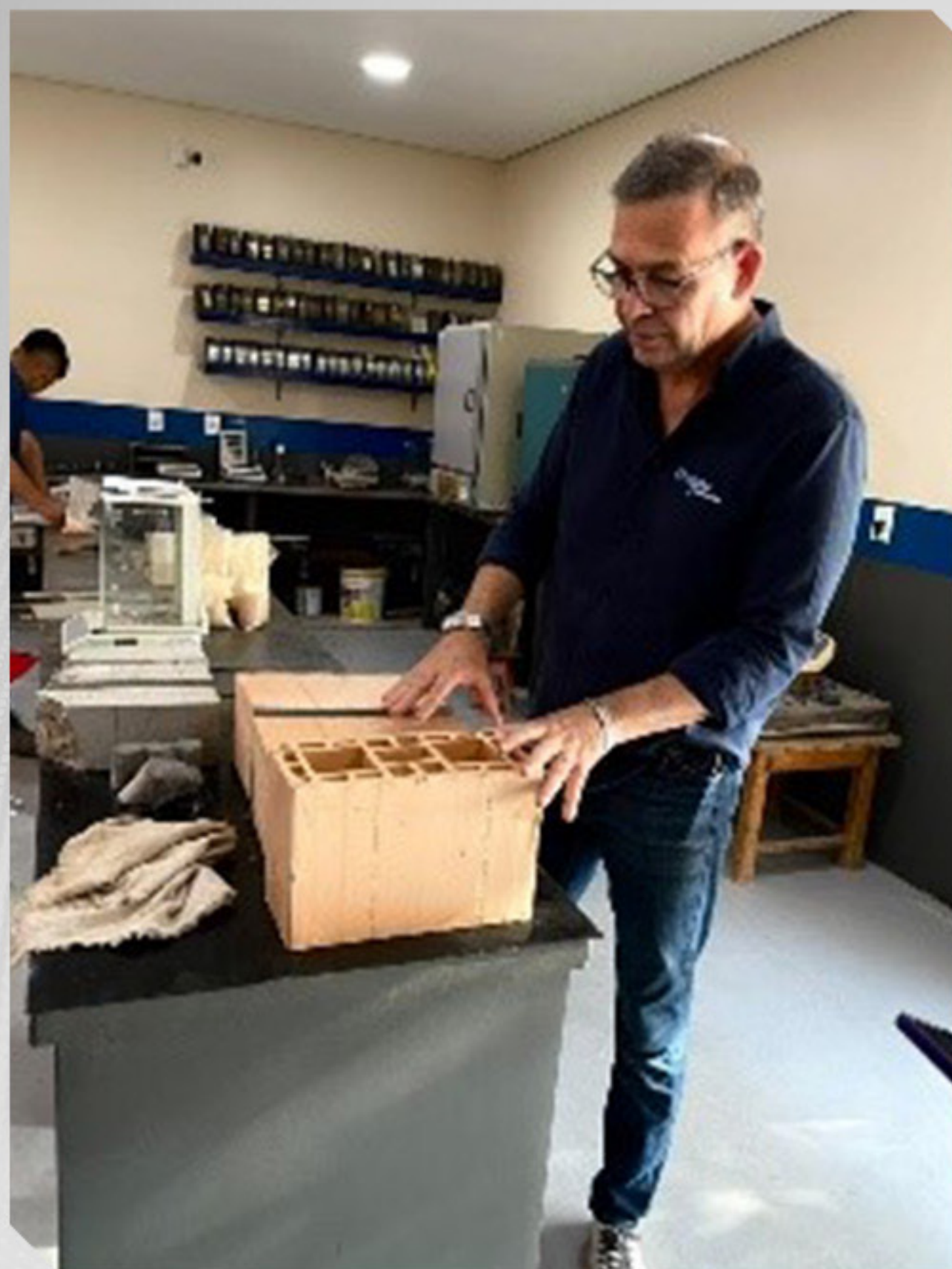
VISITA TÉCNICA A EMPRESA CONPAV