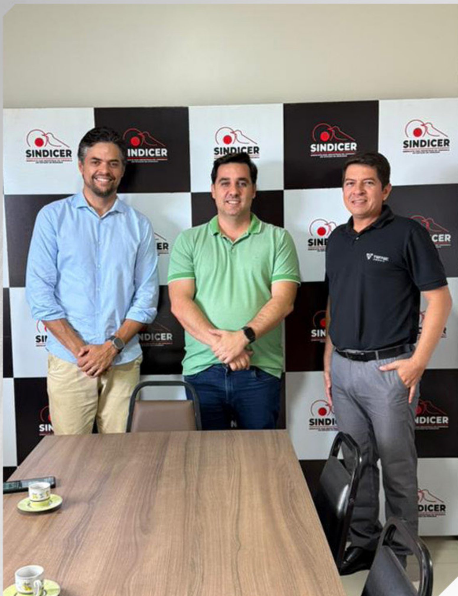
REUNIÃO COM A TRIFASE ENERGIA

Recebemos a Trifase Energia, especializada em prover soluções estruturadas com foco na eficiência e rentabilidade dos recursos energéticos. De forma prática, a empresa faz uma administração das contas de energia das empresas, com estudos sobre cobranças abusivas entre outros serviços. Todo processo é administrativo e a economia que for gerada no processo uma porcentagem será para empresa e outra como parte do pagamento dos serviços para Trifase Energia.