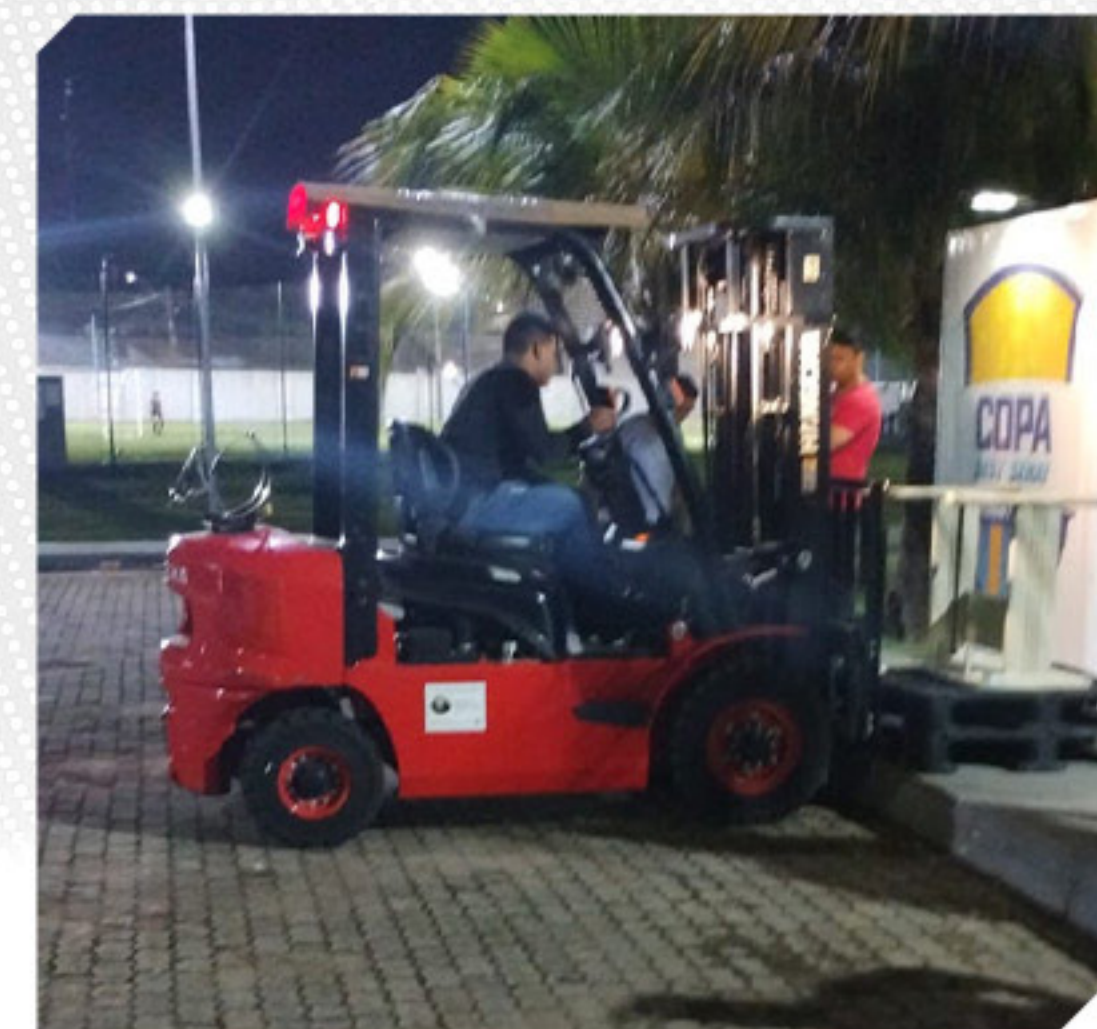
AÇÕES DE APRIMORAMENTO TÉCNICO