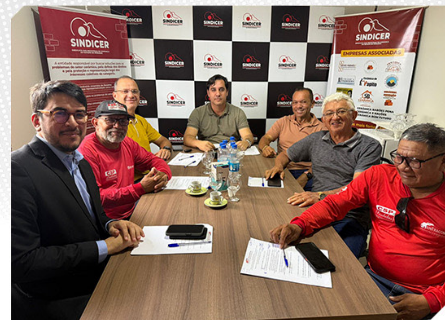
CONVENÇÃO COLETIVA DE TRABALHO

Firmamos a Convenção Coletiva de Trabalho – CCT 2026/2027 assegurando condições de trabalho justas e a harmonização das relações trabalhistas no setor cerâmico.