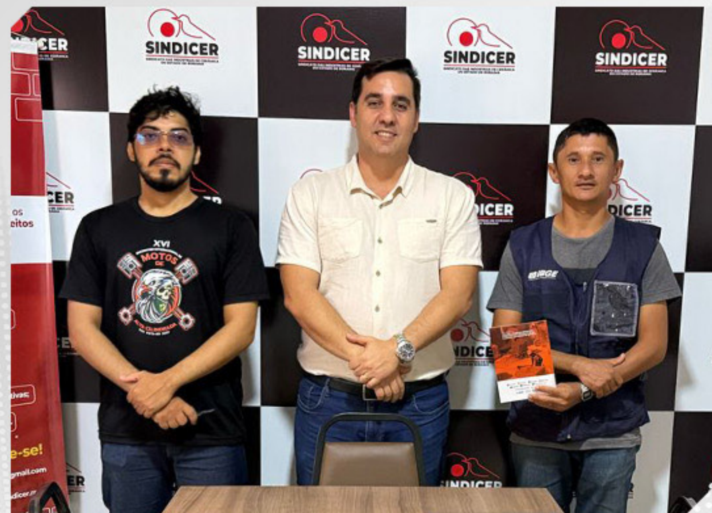
REUNIÃO COM O IBGE