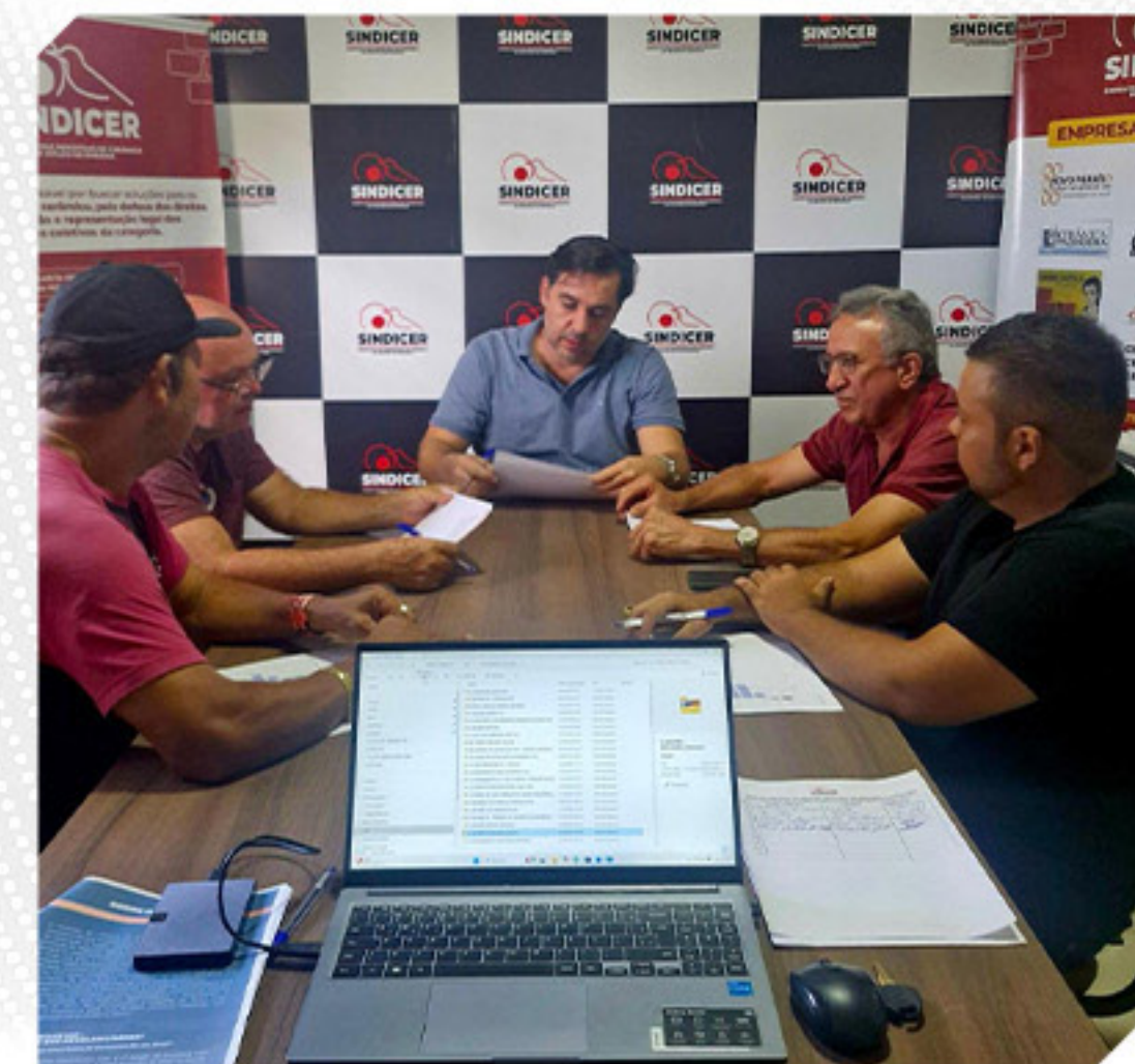
REUNIÃO ORDINÁRIA DA DIRETORIA